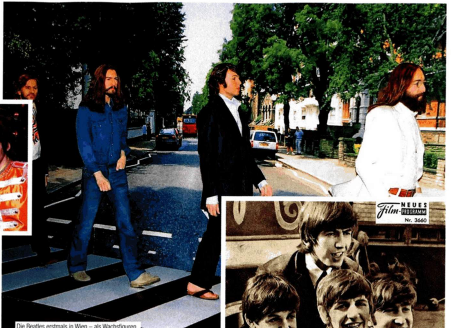
Die Beatles erstmals in Wien – als Wachsfiguren